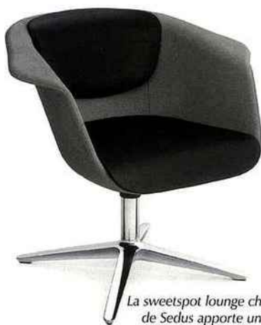
La sweetspot lounge chair de Sedus apporte un confort véritable

Hauteur d'assise agréable : avec une hauteur d'assise de 435 mm, légèrement supérieure à celle des fauteuils Lounge classiques. Pour travailler confortablement.