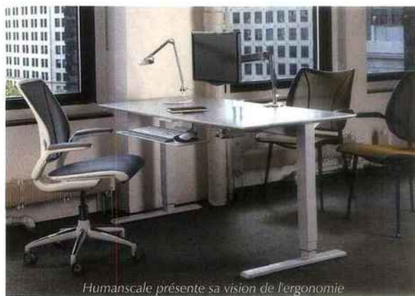
Humanscale présente sa vision de l'ergonomie