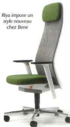
Riya impose un style nouveau chez Bene

RIYA répond à toutes les exigences techniques, tout en étant engageante et agréable. »