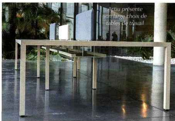
Actiu présente son large choix de tables de travail

Prisma, nouveau programme designé et développé par le département de recherche et d'innovation d'Actiu, répond