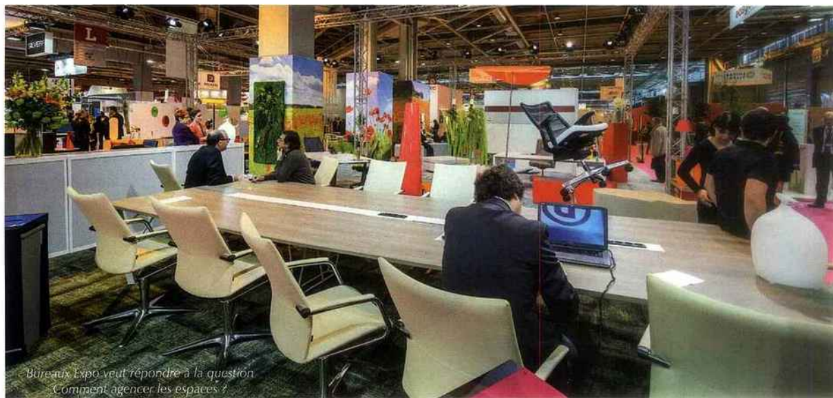
Bureaux Expo veut répondre à la question : Comment agencer les espaces ?

Le bien-être au travail fait ainsi partie des leviers essentiels d'une mission réussie, permettant d'accroître la productivité.